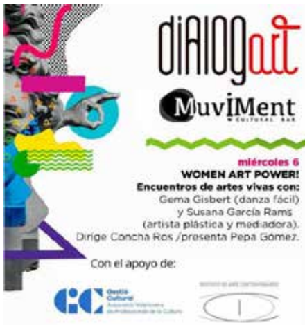
-Dialogart/MuviMent: encuentros de artes vivas WOMEN ART POWER. Charla de Gema Gisbert como docente en Danza Fácil, inclusión para personas con diversidades y difusión de la incorporación de mujeres a la formación artística +65 (abril 2022)