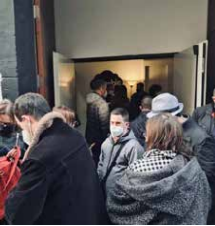
-Teatro de lo Inestable “Aus Migratòries” , Asistencia de 20 personas con distintas diversidades, alguns de ellos junto a sus familias (marzo 2022)